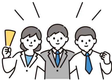
▲世代を問わず地域福祉の推進に取り組めます