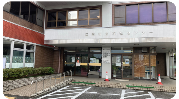
▲江南市社協の所在地は、江南市立福祉センター

「すべての市民が安心していきいきと暮らせるまち」の実現に向けて、市民のみなさまや関係機関と連携・協働して地域の福祉課題について一緒に考え、取り組んでいます。